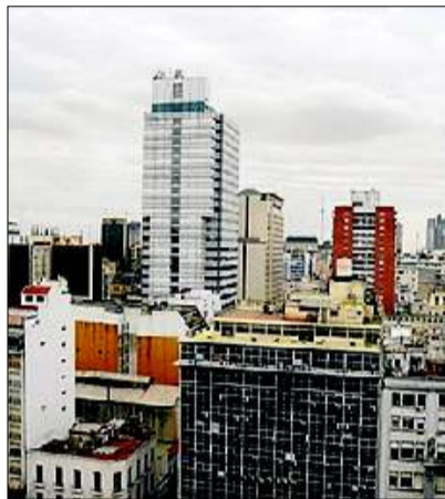
►► 'Skyline' de Buenos Aires.

El Kavanagh dilueix avui el seu portent en una ciutat on s'han aixecat centenars d'enormes torres, 70 de les quals superen els 100 metres. L'horitzó es tenyeix de formigó, es-