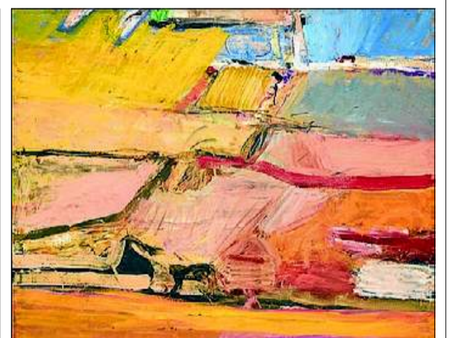
►► 'Berkeley, n° 52', de Richard Diebenkorn.