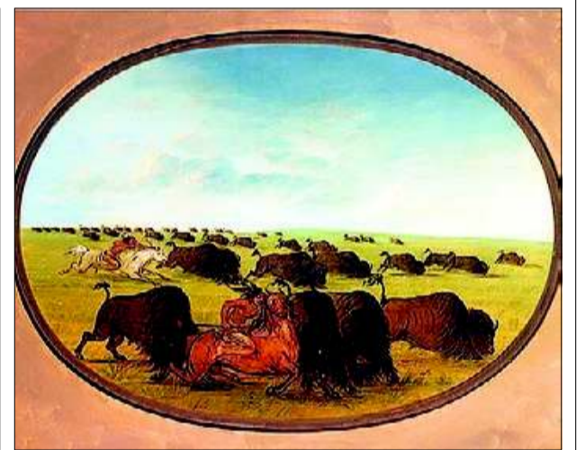
►► 'Buffalo chase, with accidents', de George Catlin.