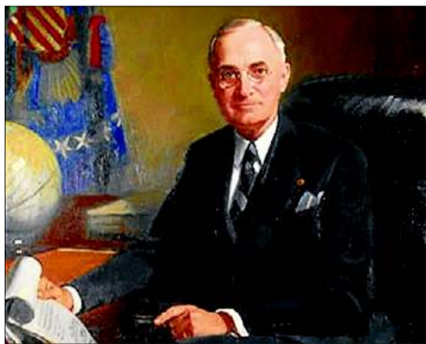
►► 'Retrat del president Truman', de Frank Salisbury.

La pintura de Ligon commemora les memòries del periodista blanc